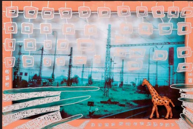
Malé krajiny VI / 20 x 30 cm / kombinovaná technika / 1999