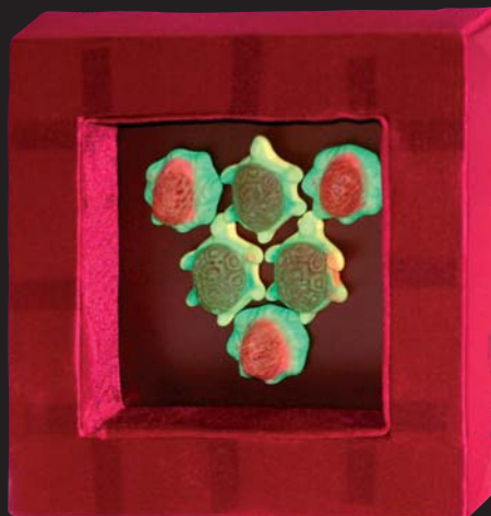
Sweet Sweden II / 19 x 19 cm / kombinovaná technika / 2001