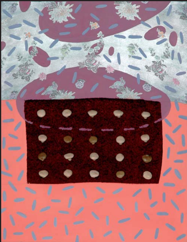
Ostrov II - C_6H_{11}O_6 - C_5H_{11}O_5 / 55 x 65 cm / kombinovaná technika / 2003