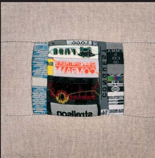
Negativní reflexe / 55 x 65 cm / kombinovaná technika / 2004