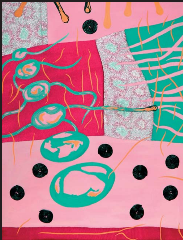
Sweet Sweden II - III-C_6H_{11}O_6-C_5H_{11}O_5 / 55 x 65 cm / kombinovaná technika / 2003