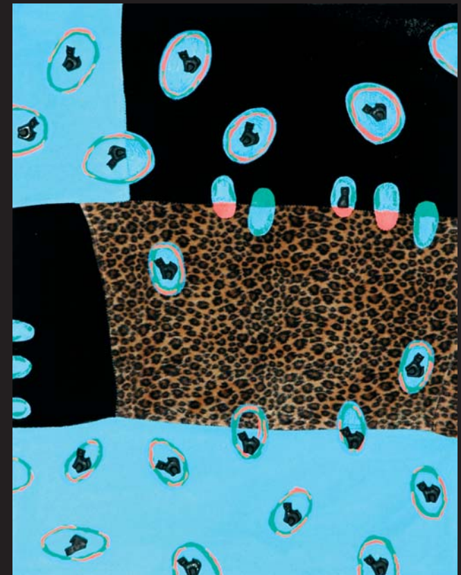
Ostrov IV - C_6H_{11}O_6 - C_5H_{11}O_5 / 55 x 65 cm / kombinovaná technika / 2003