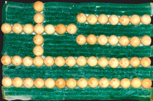
Řecká vlajka / 16 x 22 cm / kombinovaná technika / 2004