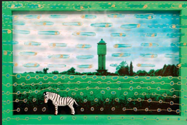
Malé krajiny II / 20 x 30 cm / kombinovaná technika / 1999