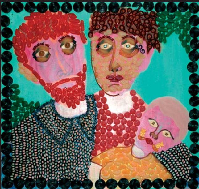
Sladká mozaika (rodina) / 70 x 68 cm / kombinovaná technika / 2003