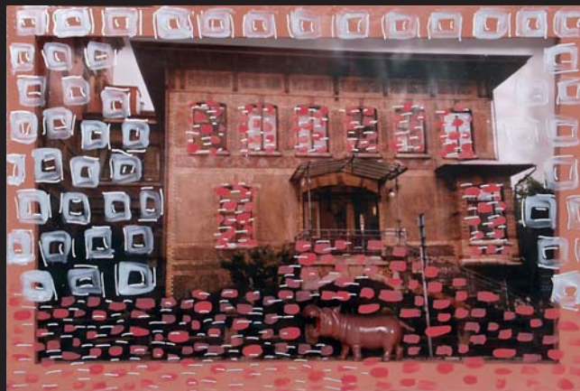
Malé krajiny V / 20 x 30 cm / kombinovaná technika / 1999