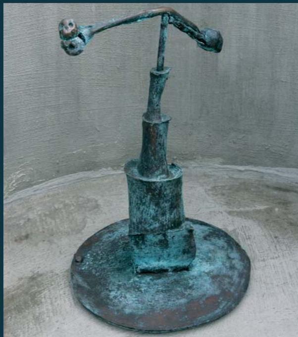
Střelka / výška 47 cm / bronz / 2005