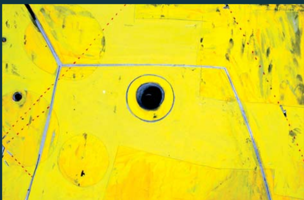
Velká díra / 55 x 86 cm / kombinovaná technika / 2005