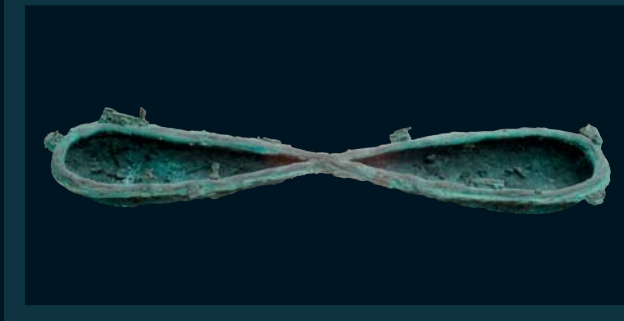
Nekonečně / 116 x 24 cm / bronz / 2006