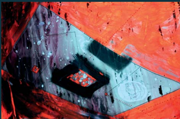
Hřiště / 53,5 x 84 cm / kombinovaná technika / 2007