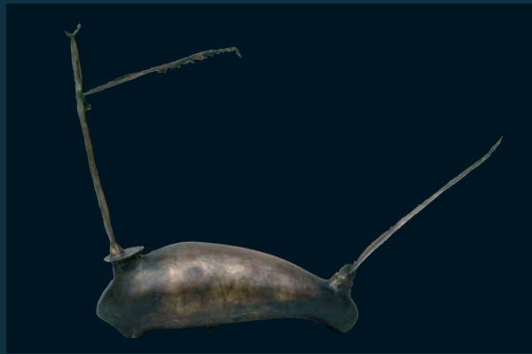
Animalanten / 38 x 60 x 15 cm / bronz / 2008