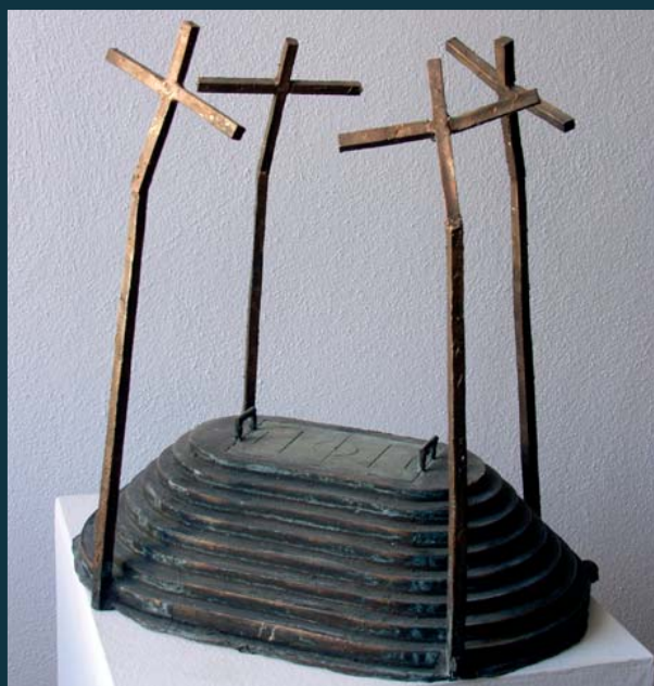
Svatyně současnosti / 34 x 32 x 23 cm / bronz / 2005