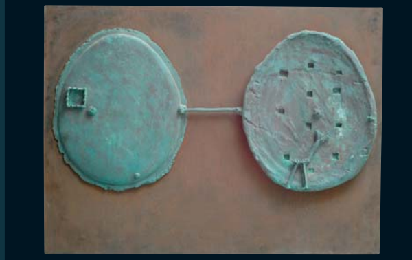
Dvojčata / 79 x 95 cm / bronz / 2002