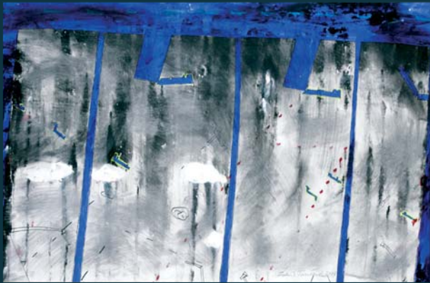
Přístav / 83,5 x 52,5 cm / kombinovaná technika / 2005