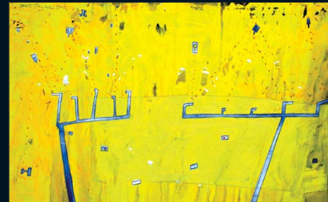
Pouštní operace / 55 x 86 cm / kombinovaná technika / 2007