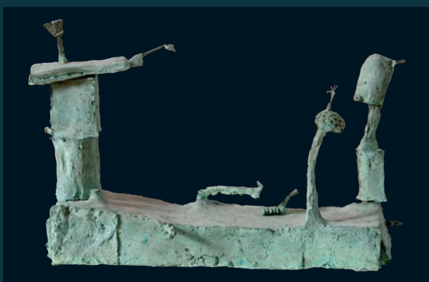
Ze života hmyzu / 42 x 66 x 18 cm / bronz / 2001