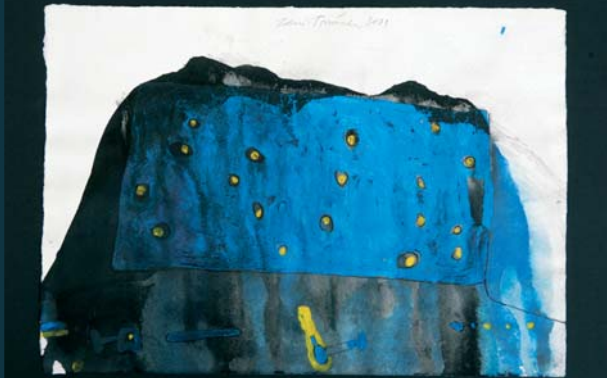
Paměti / 29,5 x 42 cm / kombinovaná technika / 2001